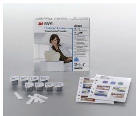
Protemp Crown Próbakészlet