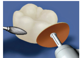
3. Finirozza és polírozza!

A Protemp™ Crown egy színárnyalatban és széles formaválasztékkal rendelkezik. Az elkészítéshez egyszerűen válassza ki a megfelelő méretet és adaptálja a környezetéhez! Világítsa meg, polírozza majd ideiglenes ragasztóval (RelyX™ Temp NE) rögzítse!