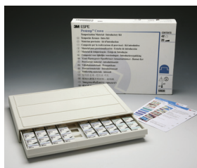
Protemp Crown Bevezető Készlet